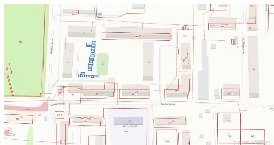
Схема размещения гаражей, являющихся некапитальными сооружениями, по ул. Заводская, в районе дома №36 пгт. Урмары Урмарского района Чувашской Республики

М 1:2000 Условные обозначения – места размещения гаражей, являющихся некапитальными сооружениями – граница земельного участка, учтенного в ЕГРН