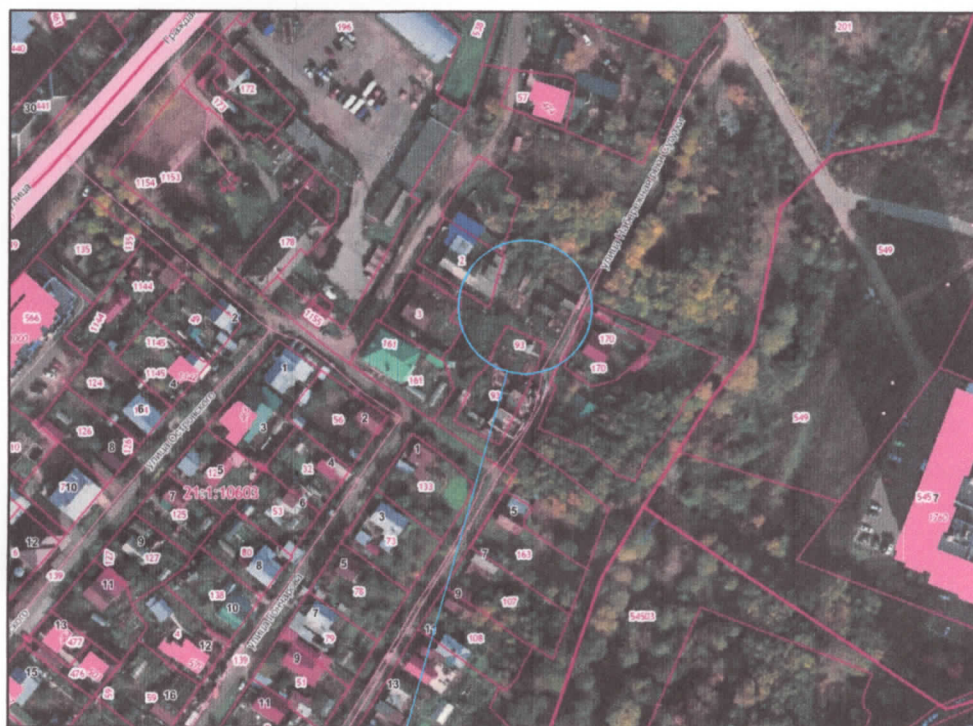
образуемый земельный участок