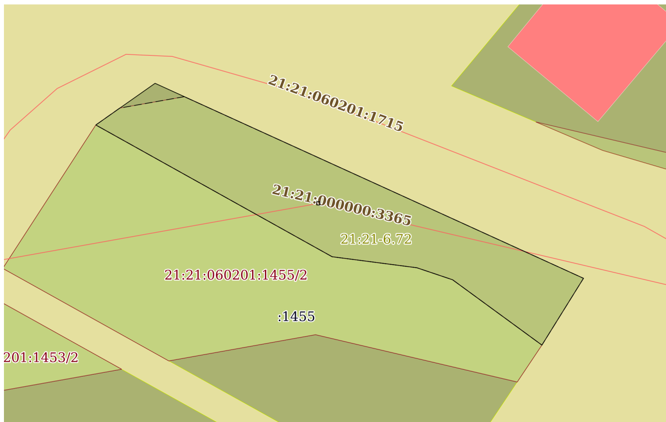
План (чертеж, схема) земельного участка