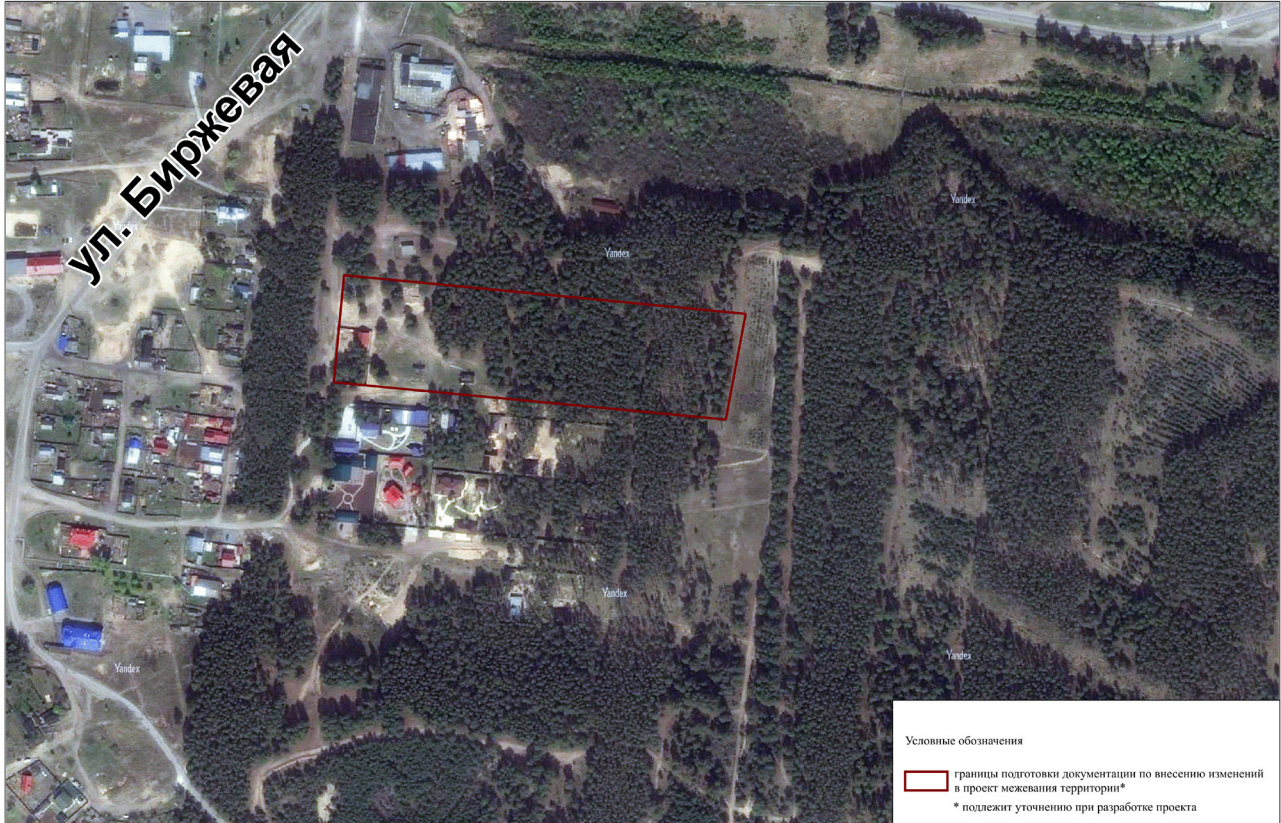
Приложение №1 к постановлению администрации города Чебоксары от 16.12.2024 № 3951

Приложение № 2 УТВЕРЖДЕНО постановлением администрации города Чебоксары от 16.12.2024 № 3951