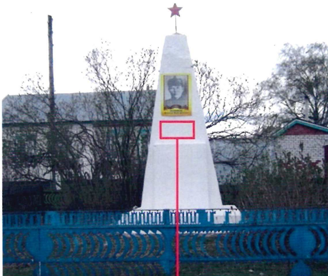
Фото памятника с привязкой к месту установки информационной надписи.