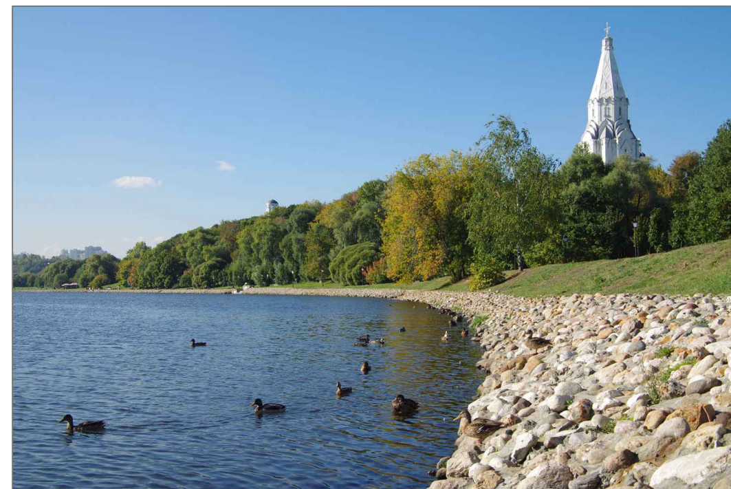
БЛАГОУСТРОЙСТВО И УКРЕПЛЕНИЕ СКЛОНОВ РЕКИ ПАРКЛЕТАМИ И ПРИРОДНЫМ КАМНЕМ: