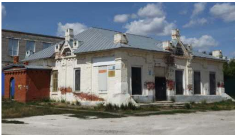
Объект культурного наследия регионального значения «Торговая лавка», начало XX в. (Чувашская Республика, Яльчикский район, с. Яльчики, ул. Кооперативная, д. 79)