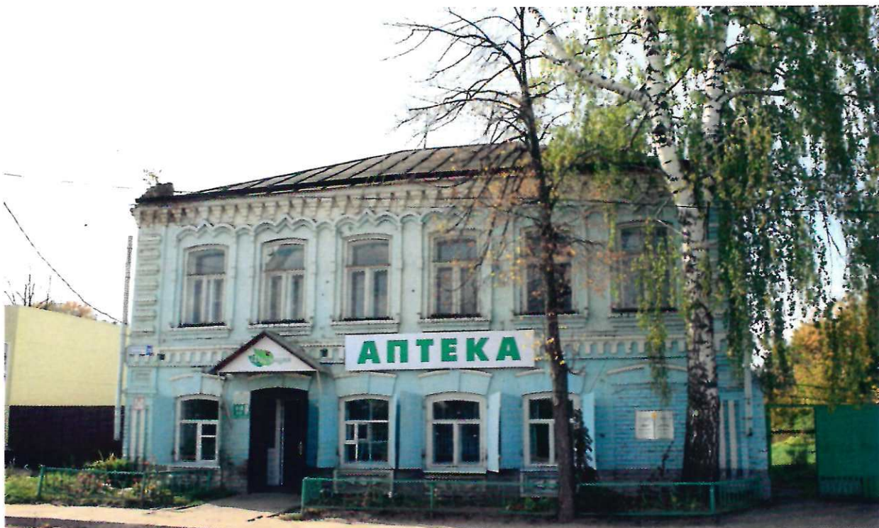
Фото фасада с привязкой к месту установки информационной надписи.

На фасаде здания на уровень первого этажа (фотомонтаж)