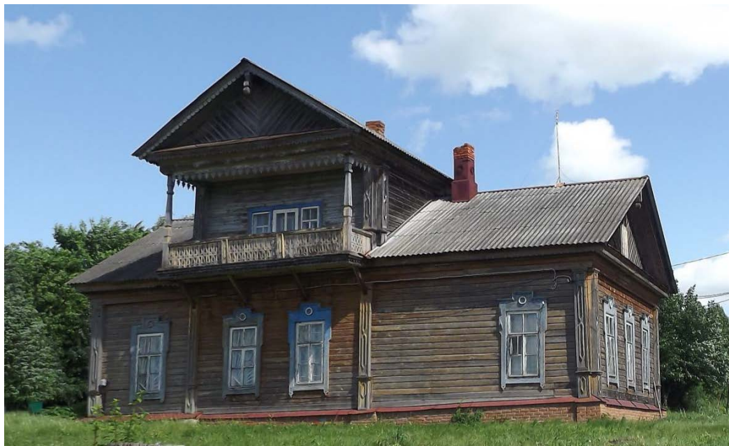
Объект культурного наследия регионального значения «Дом А.А. Буйновского», 1887 г. (Чувашская Республика, Яльчикский район, Яльчикское сельское поселение, с. Яльчики, ул. Восточная, д.1)