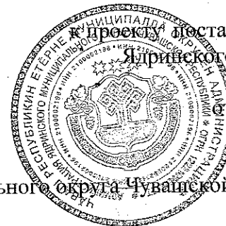
Схема размещения мобильной торговли на территории Ядринского муниципального округа Чувашской Республики