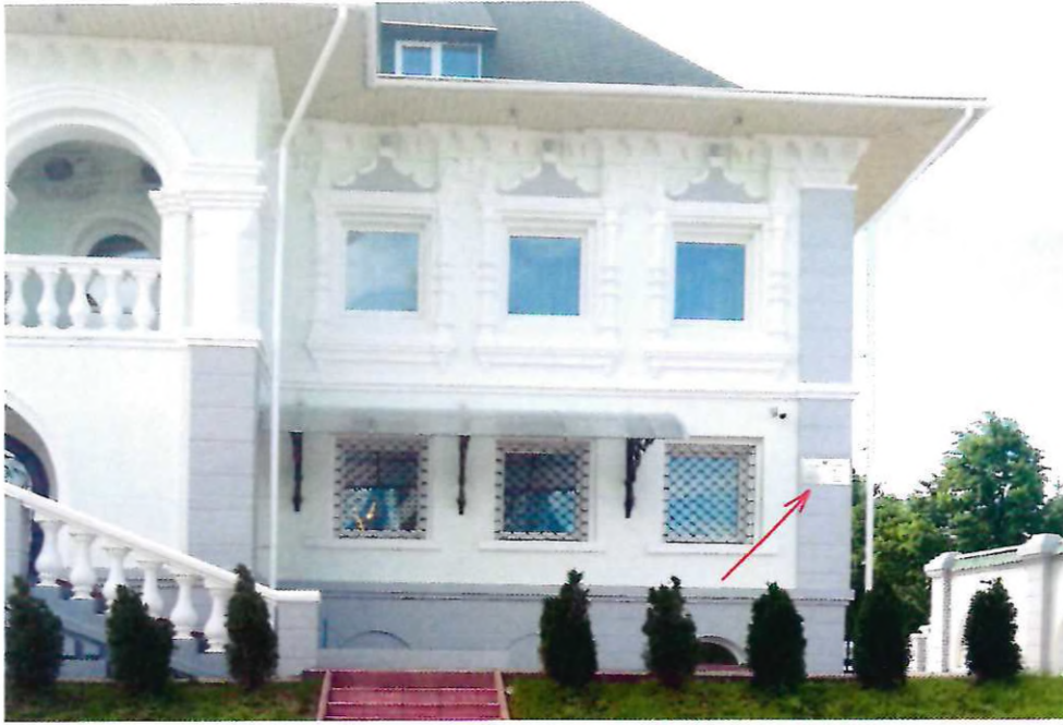
Фото фрагмента фасада с привязкой к месту установки информационной таблички.