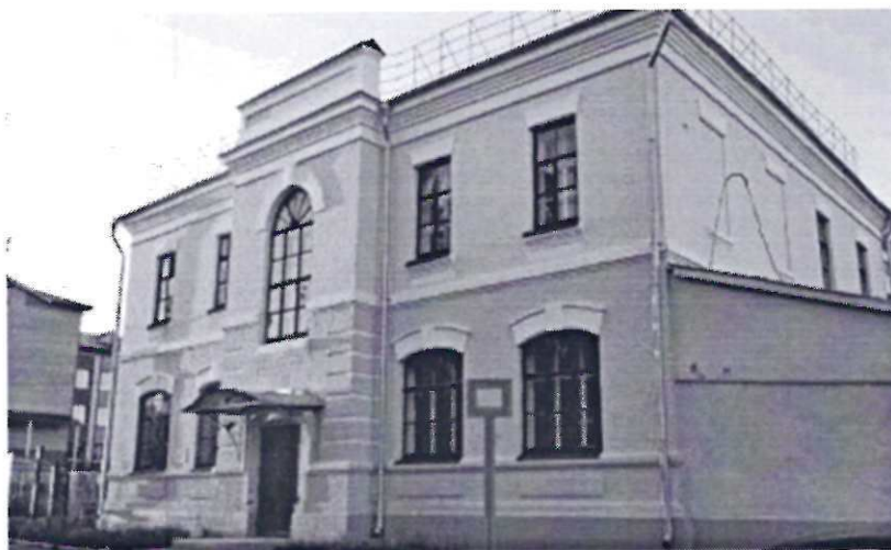
Фото фрагмента фасада с привязкой к месту установки информационной надписи.