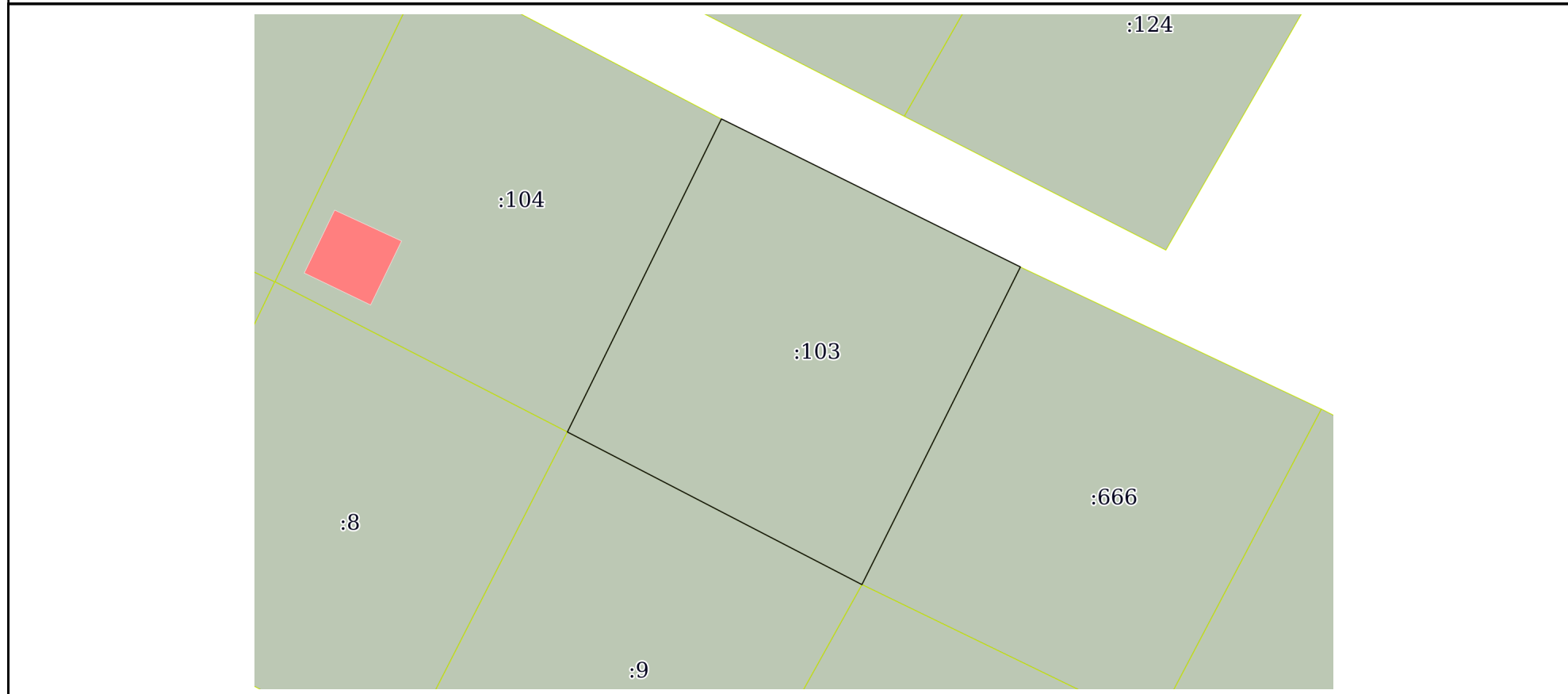
План (чертеж, схема) земельного участка