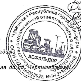
Схема организации дорожного движения и ограждения мест производства работ на время производства работ по ремонту автомобильной дороги "улица К. Маркса" в городе Канаш Чувашской Республики (3-й этап участок от ул. Муссы Джалиля до ул. Чернышевского) Период производства работ: с 07.08.2023г. по 01.09.2023г.