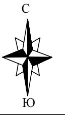
Схема расположения границ публичного сервитута на кадастровом плане территории