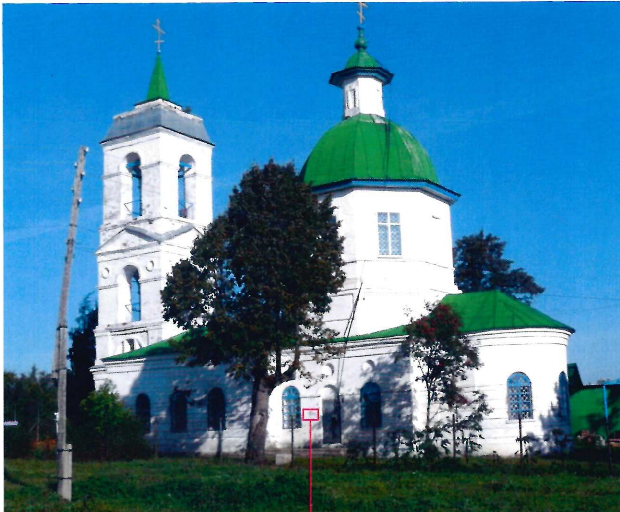
Фото фрагмента фасада с привязкой к месту установки информационной надписи.