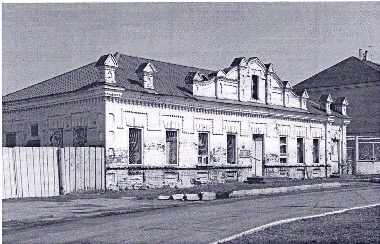
Фото фасада с привязкой к месту установки информационной надписи.