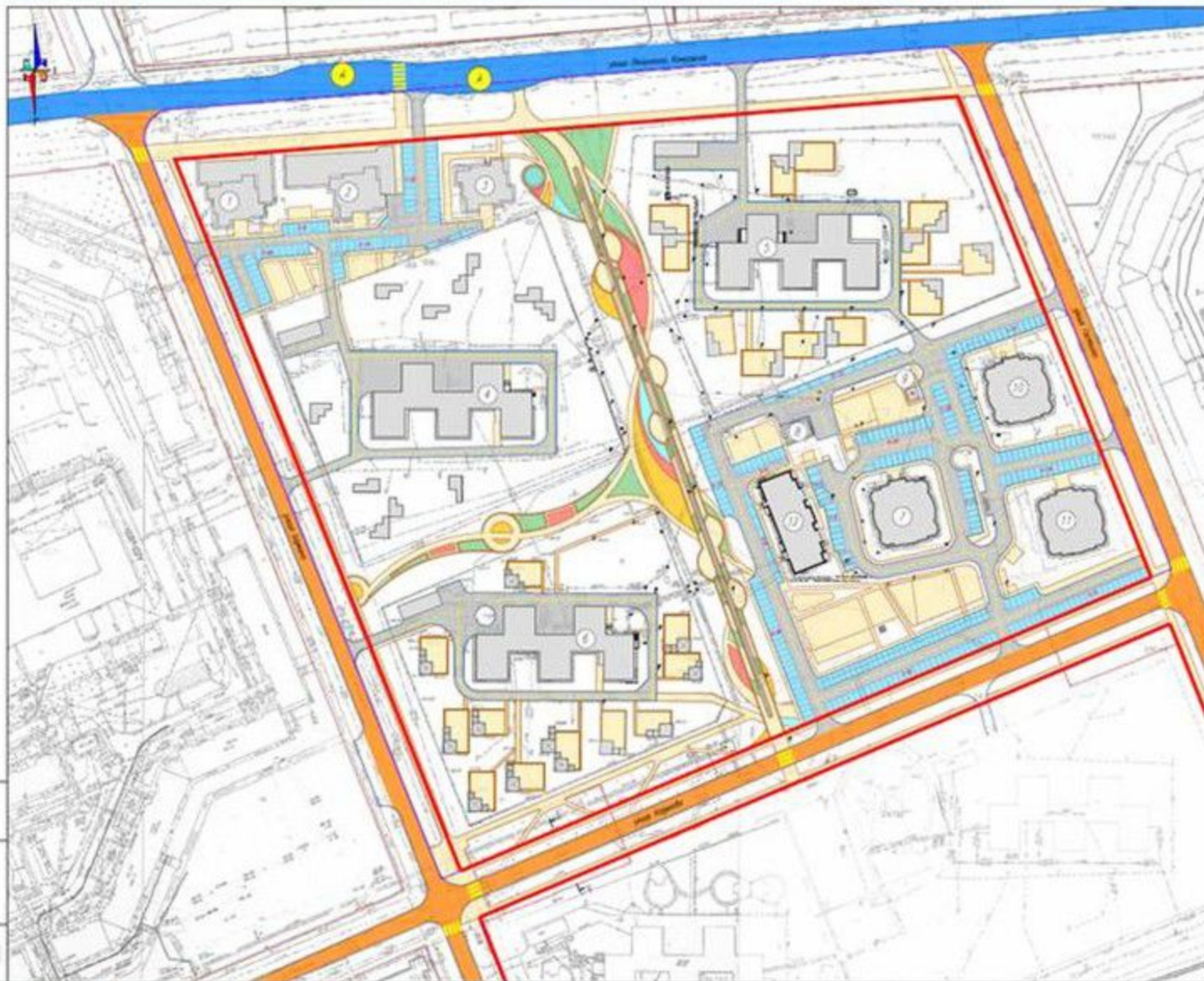
Комплекс жилых и общедомовых зданий и сооружений