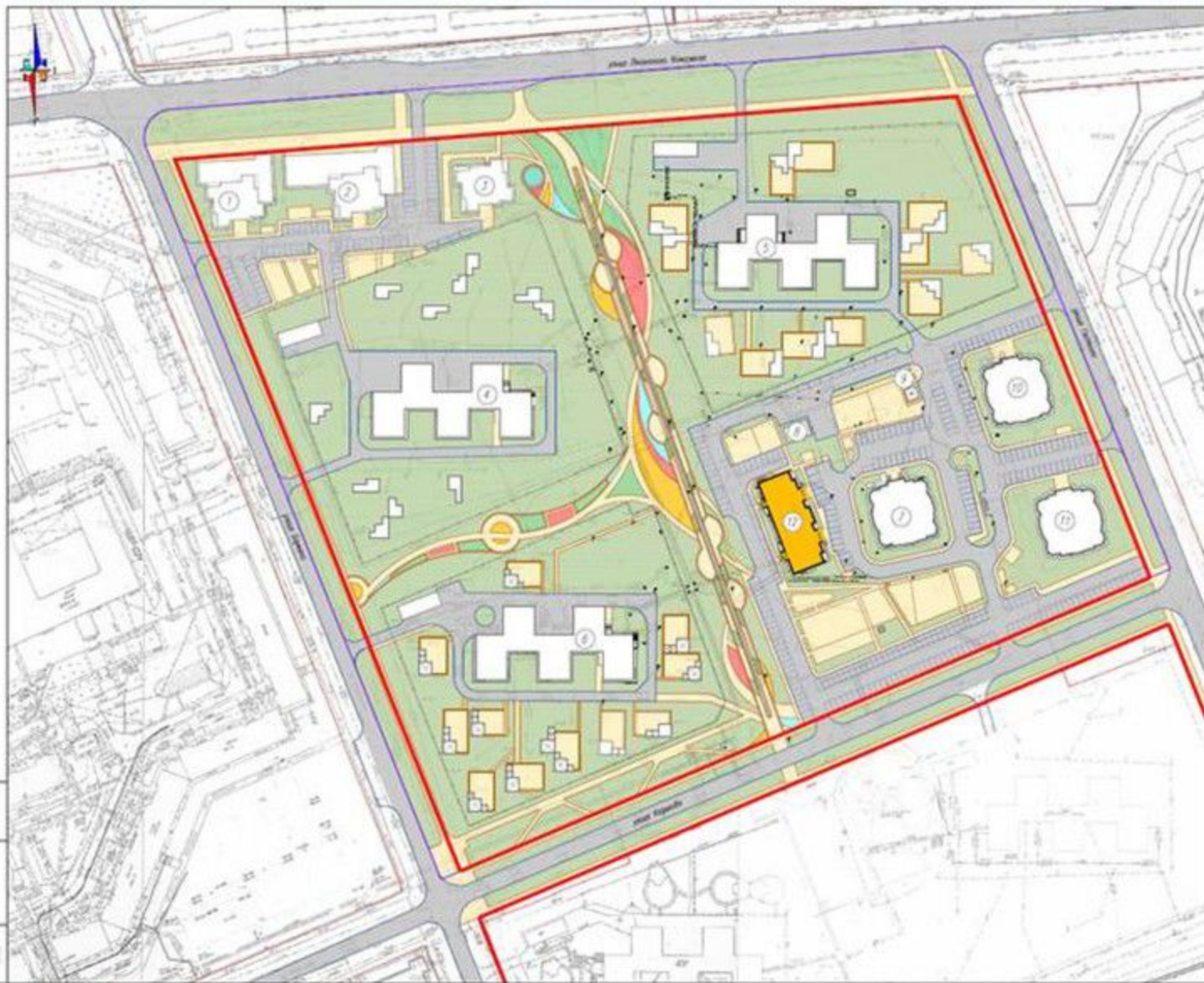
Вспомогательные жилые и общественные здания и сооружения