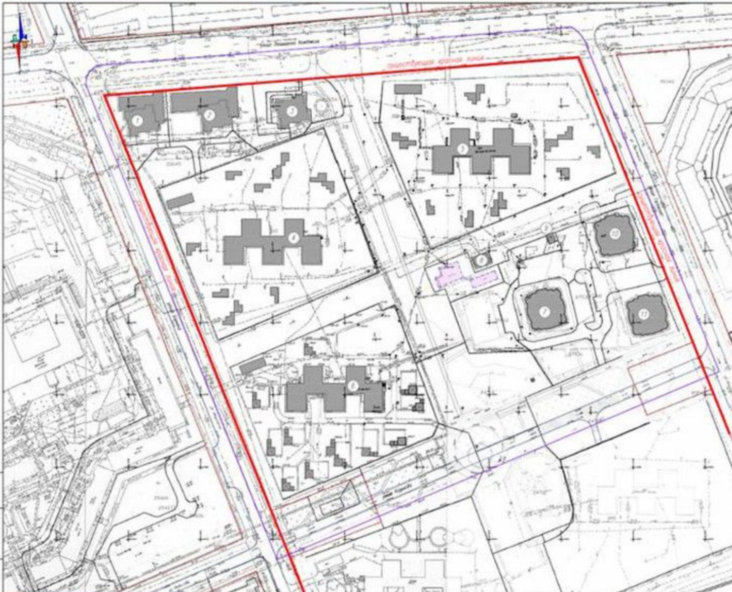
Ситуационный план и планировка территории