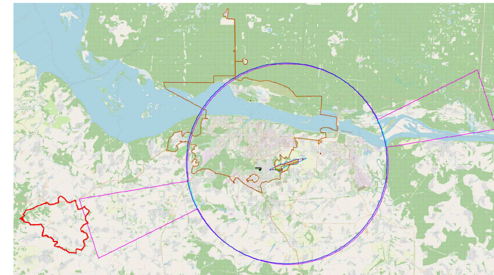
Приаэродромные территории аэродрома Чебоксары

Приаэродромная территория аэродрома Чебоксары (подзона 5)