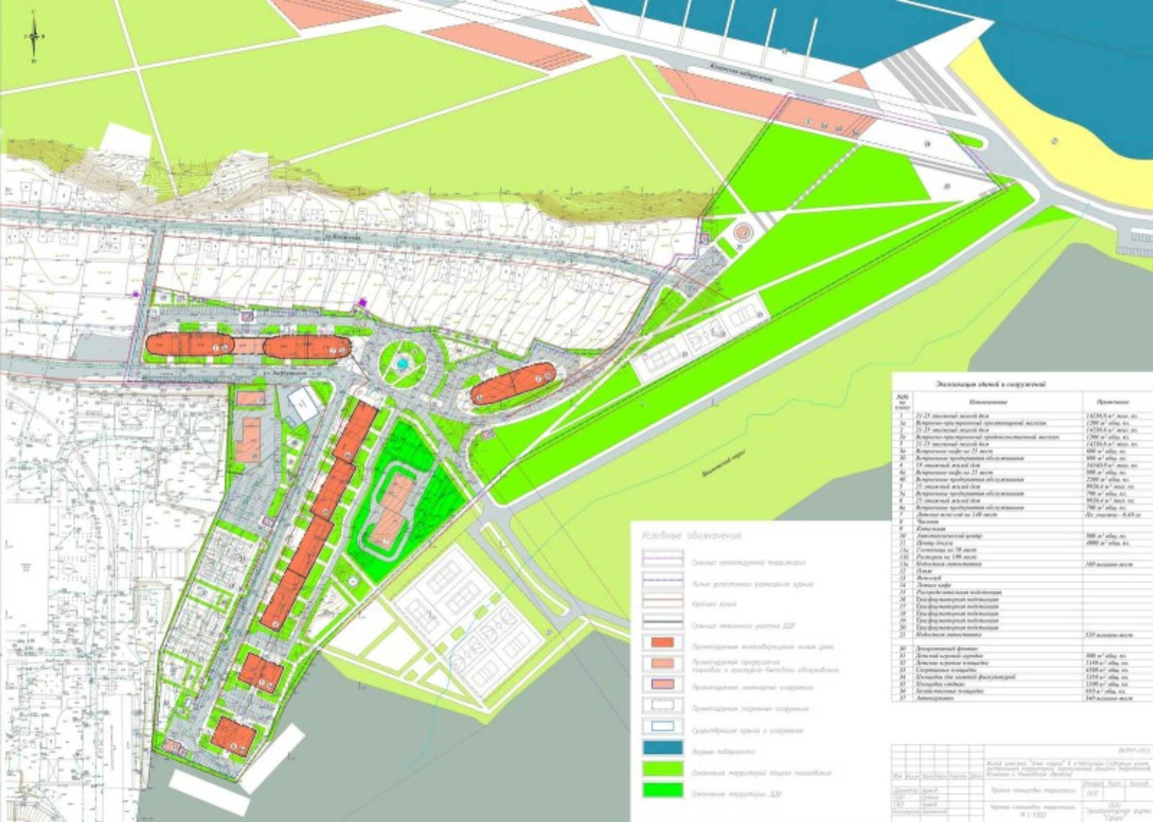
Детализация зданий и сооружений