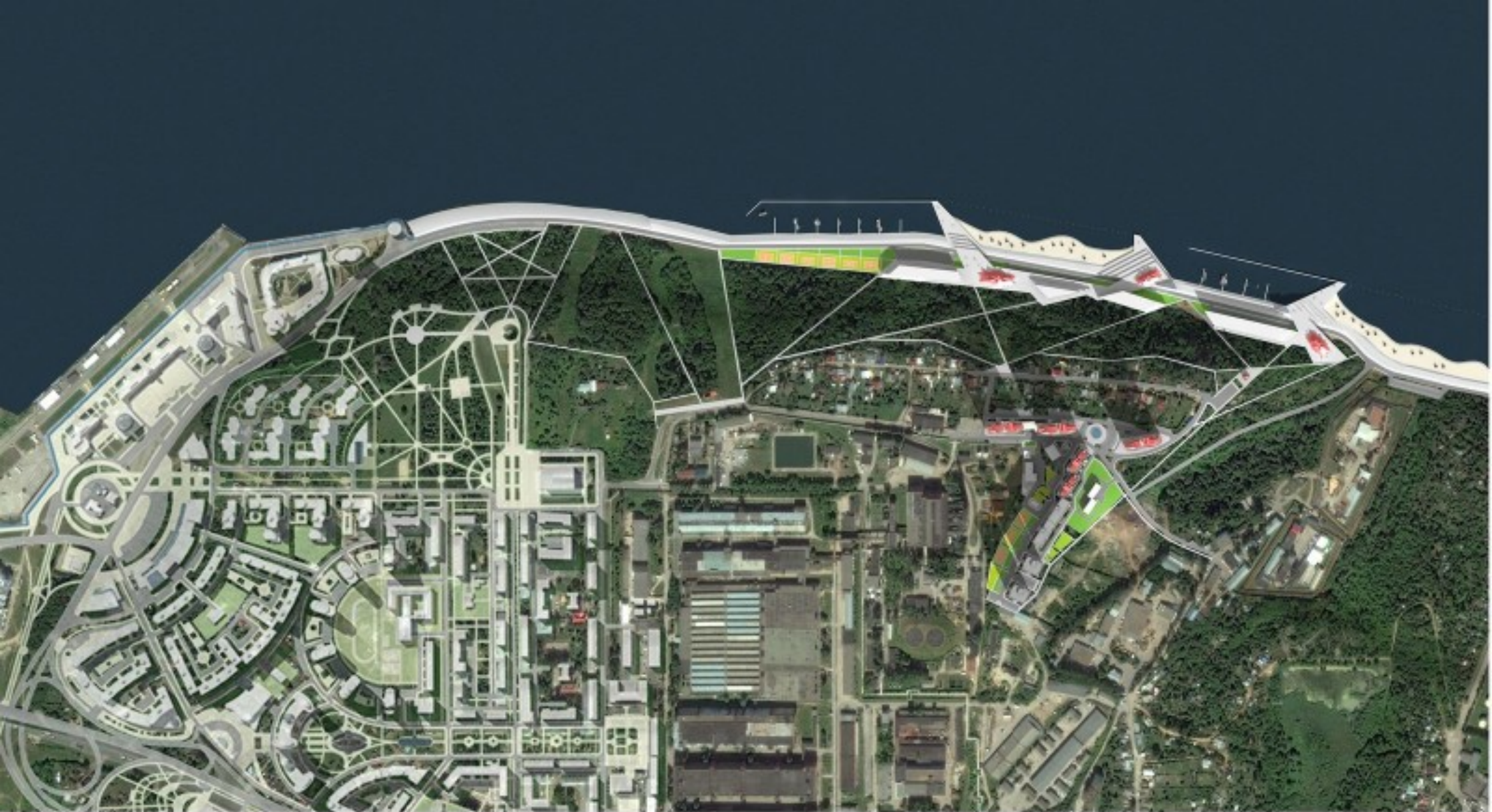
Схема планировки территории