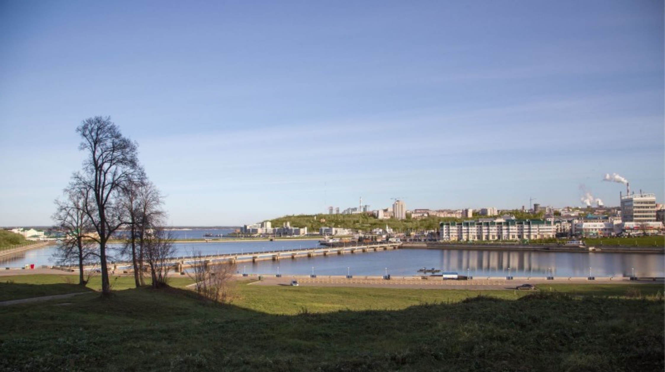
Вид в существующей застройке