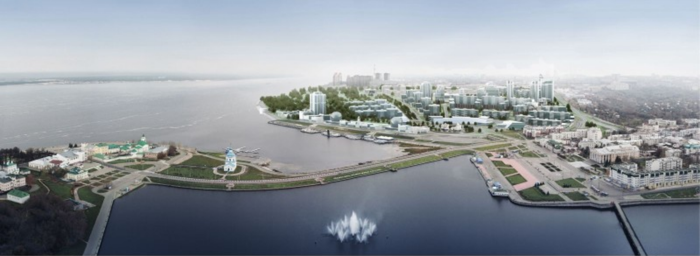
Вид в существующей застройке