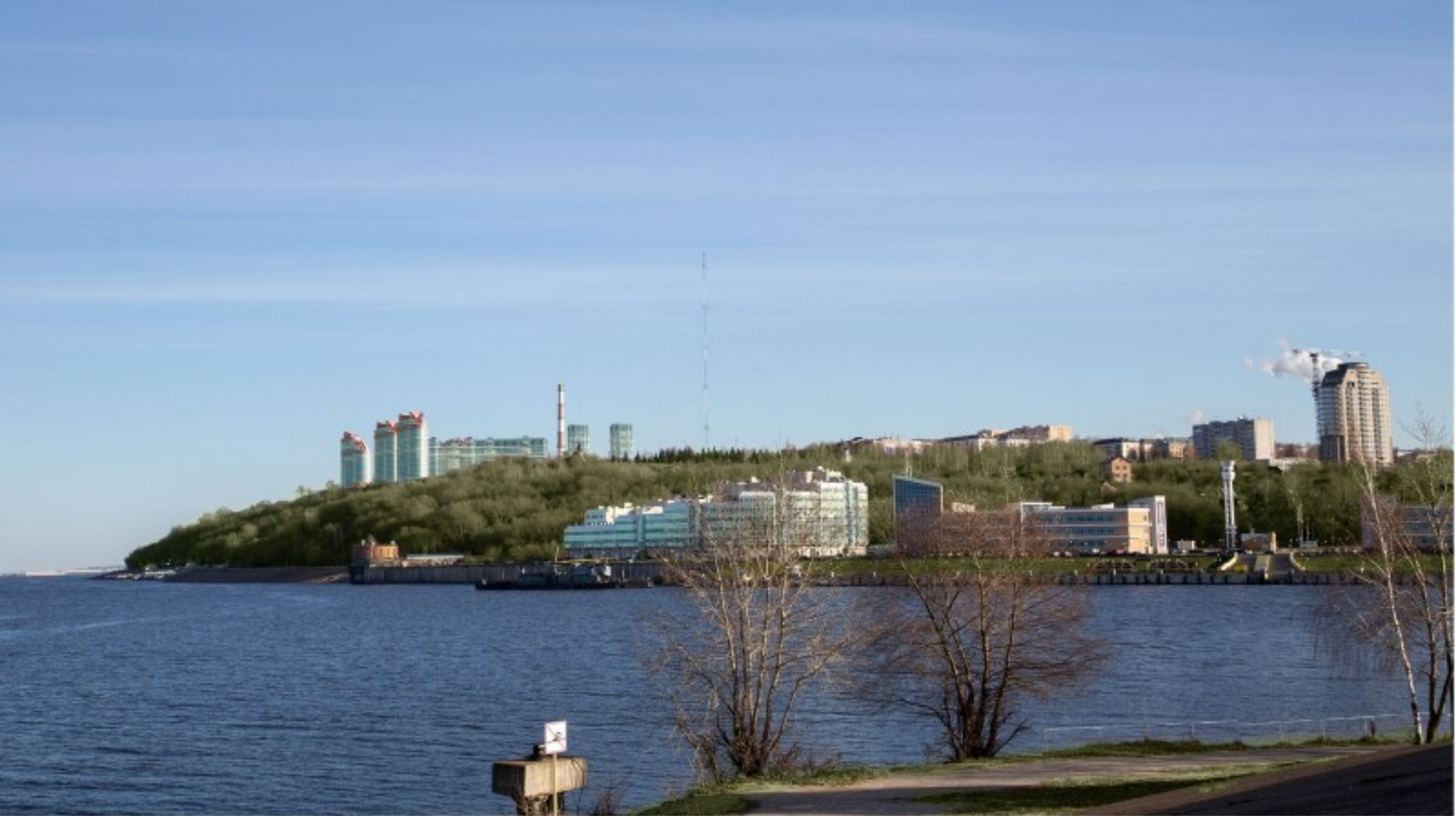
Вид в существующей застройке