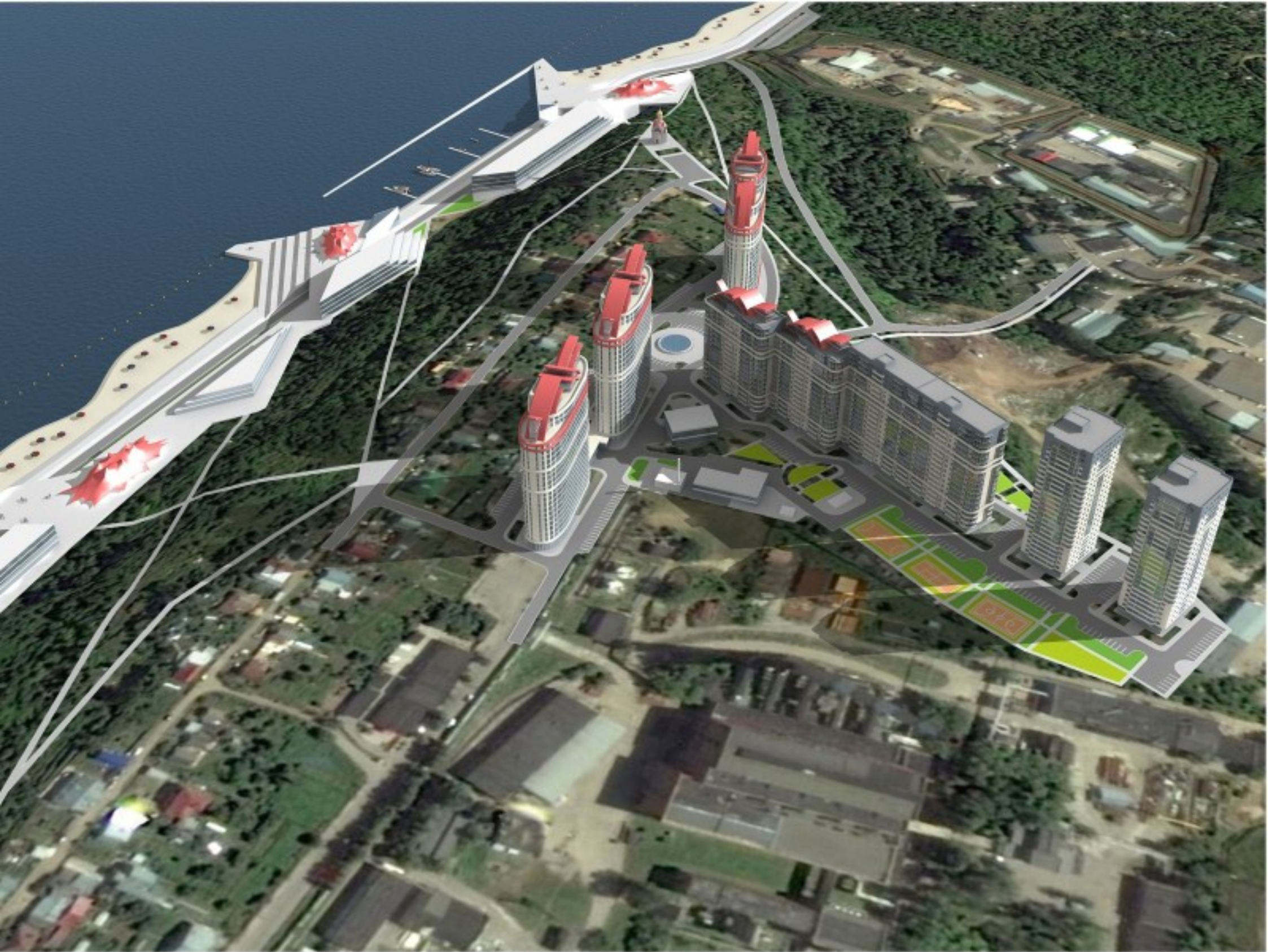
Общий вид застройки