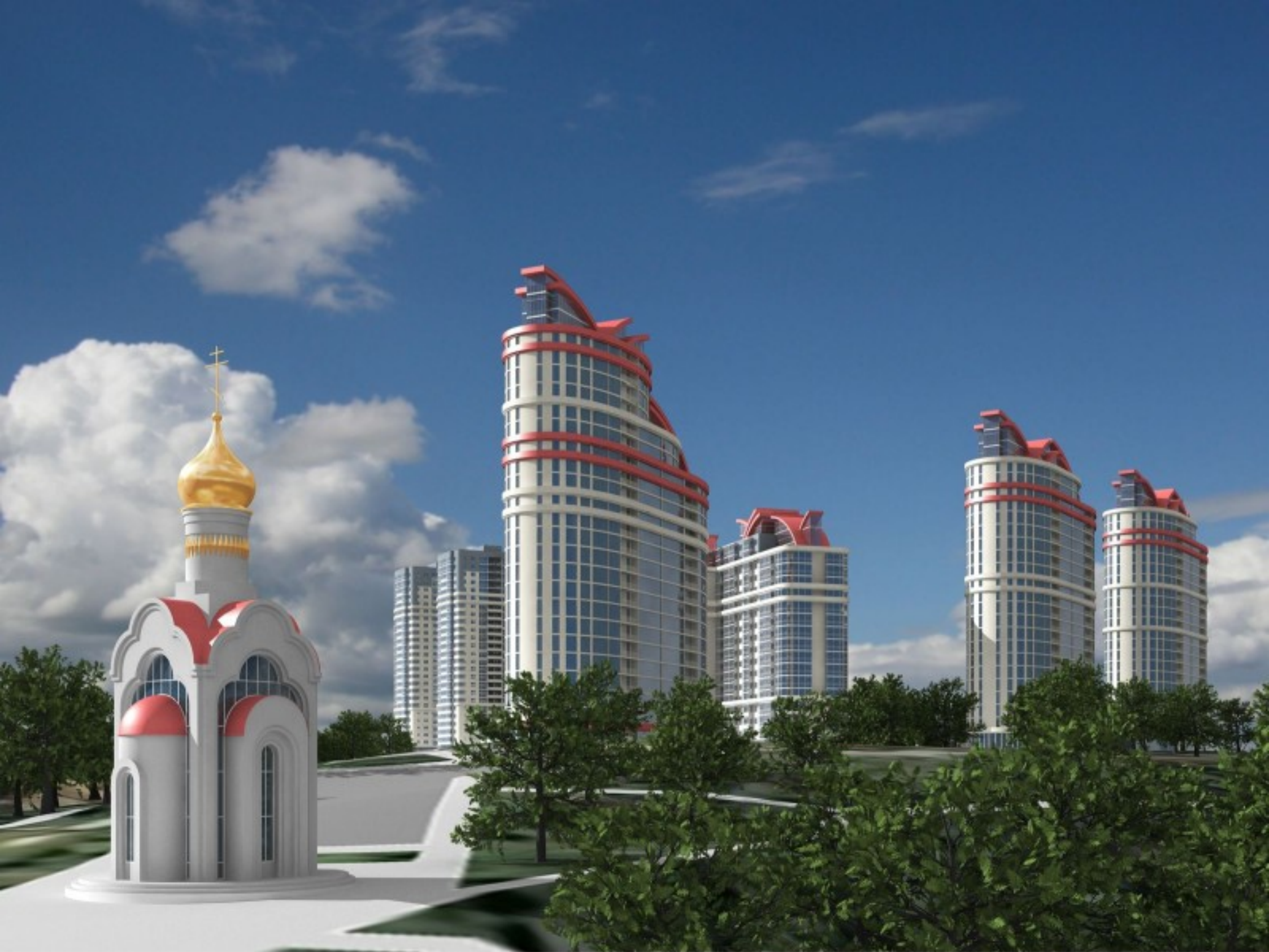
Общий вид застройки