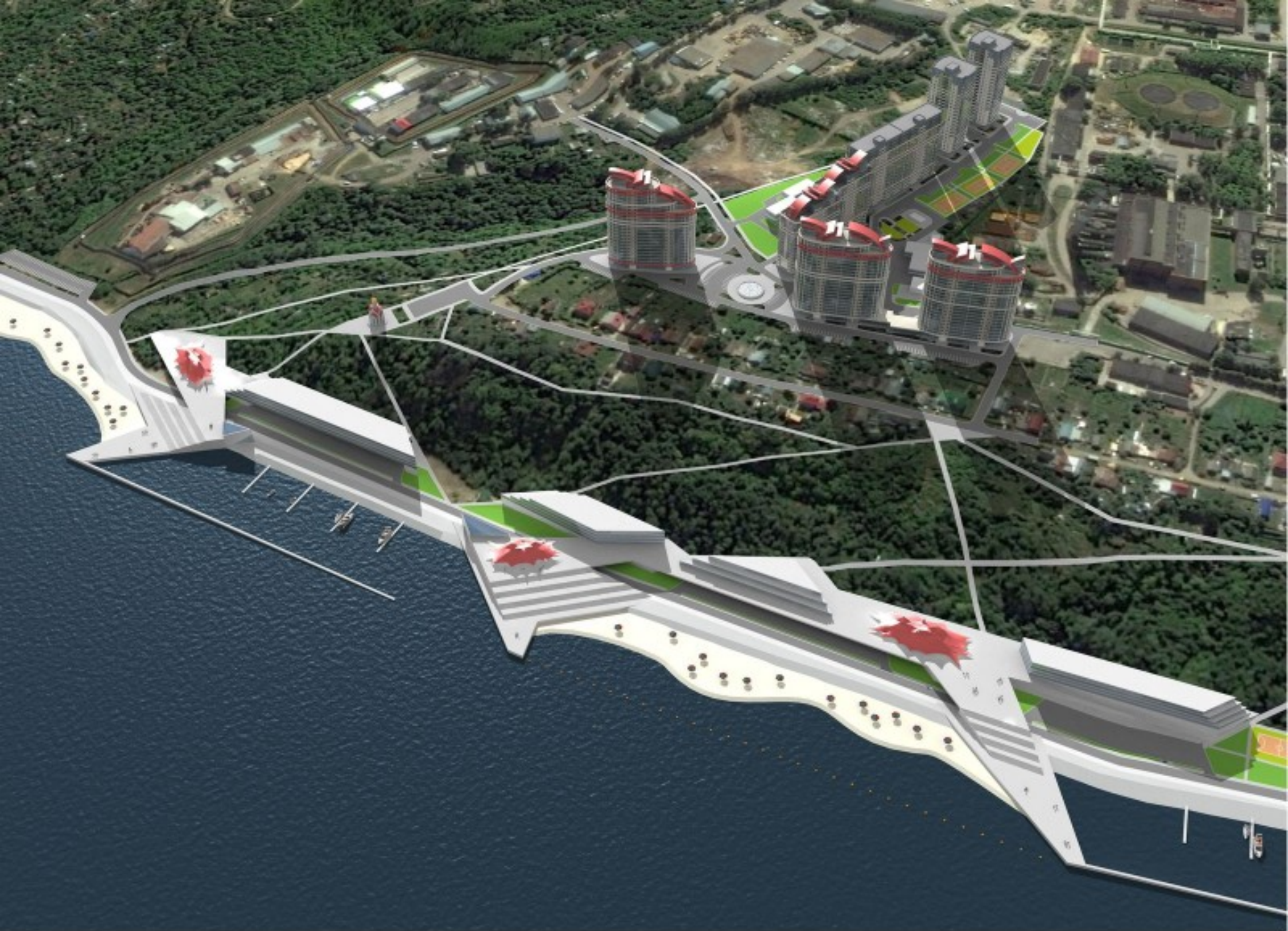
Общий вид застройки