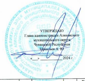
Карта целевого процесса сбора информации для мониторинга показателей социально-экономического развития Алковского муниципального округа Чувашской Республики