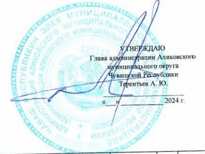
Карта текущего процесса сбора информации для мониторинга показателей социально-экономического развития Алкювского муниципального округа»