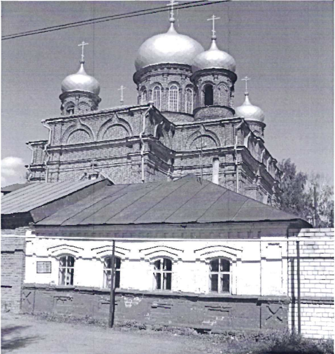
Фото фасада с привязкой к месту установки информационной надписи.