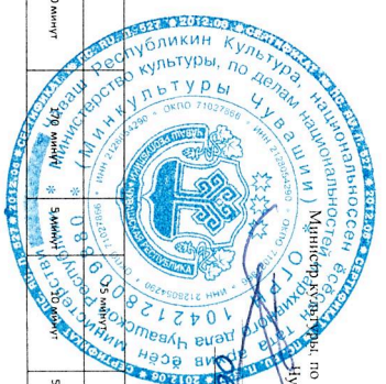
Титульная карта проекта «Оптимизация процесса сбора аналитических и статистических сведений детских школ искусств Чувашской Республики»