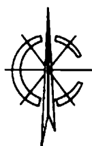
Схема границ территории объекта культурного наследия (памятника истории и культуры) регионального (республиканского) значения «Памятный камень, установленный на месте дома, где родился поэт (М. Сеспель)», 1899 г., расположенного по адресу: Чувашская Республика, Канашский муниципальный округ, д. Сеспель (далее - объект культурного наследия):