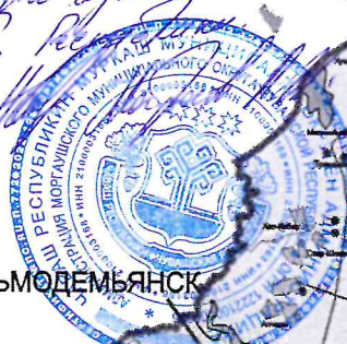
ПОЛОЖЕНИЕ МОРГАУШСКОГО РАЙОНА В ЧУВАШСКОЙ РЕСПУБЛИКЕ

Целью документа План Моргаушского городского округа Чувашской Республики 15.07.2023 г.