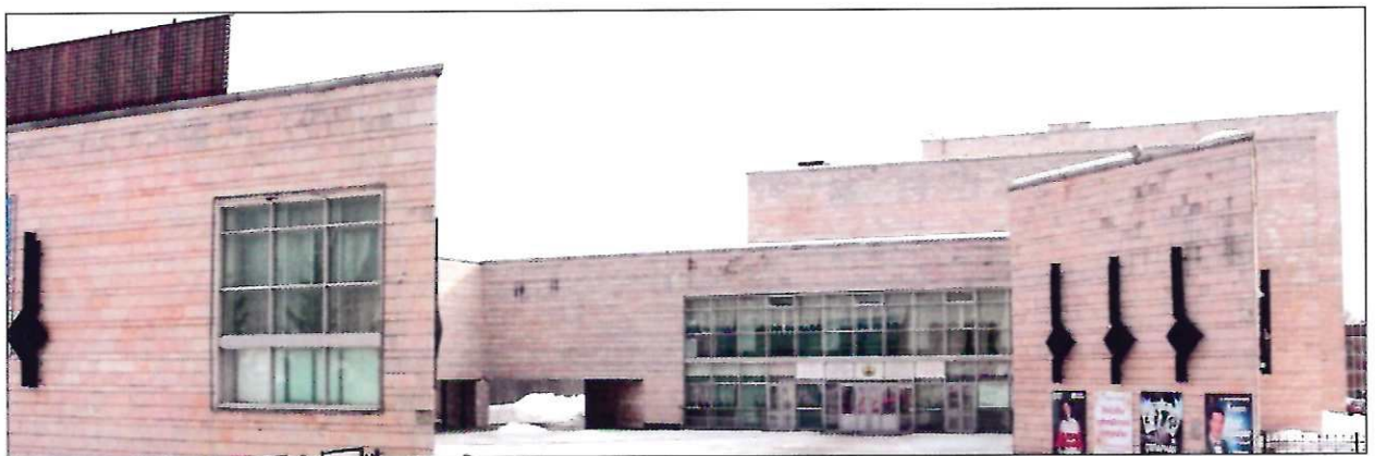
Фото № 3. Общий вид объекта, обладающего признаками объекта культурного наследия, начало 2017 г.