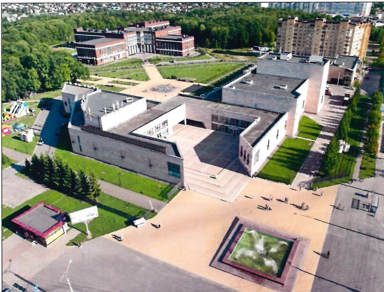
Фото №4. Объект, обладающий признаками объекта культурного наследия, вид сверху.