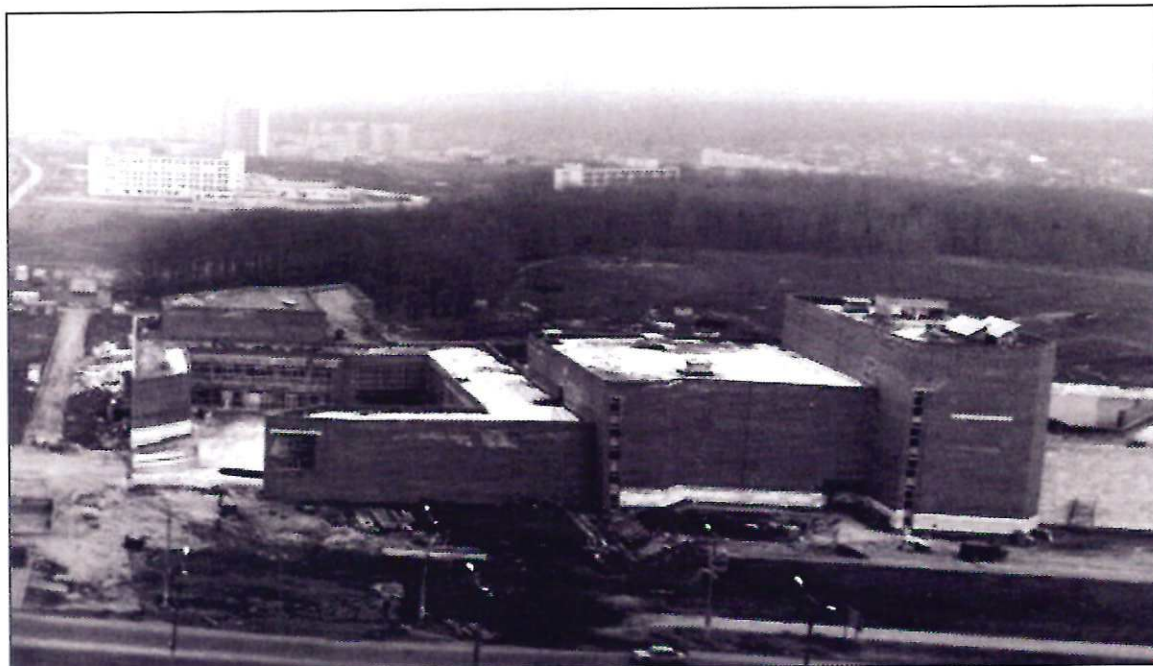
Фото № 1. Общий вид, объекта, обладающего признаками объекта культурного наследия, начало 1990-х гг.

Фотофиксация объекта, обладающего признаками объектами культурного наследия, расположенного по адресу: расположенного по адресу: Чувашская Республика, г. Чебоксары, Эгерский бульвар, д. 36