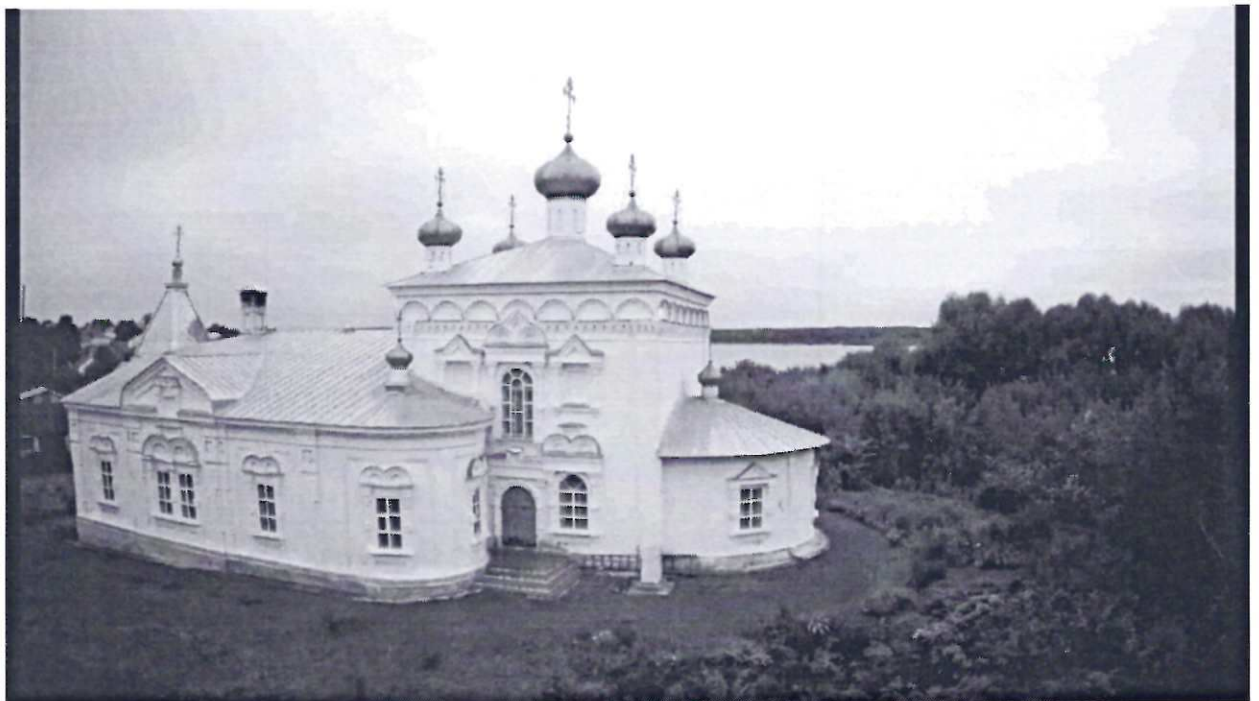
Общий вид церкви (фото 2022г)