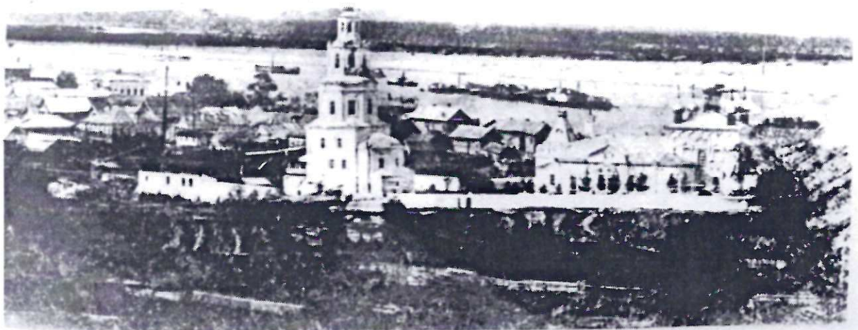
Міський пейзаж. Троїцький собор.