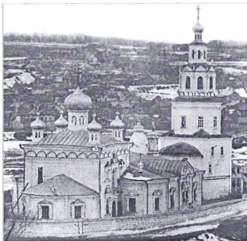
Общий вид церкви (фото начало 20 века)