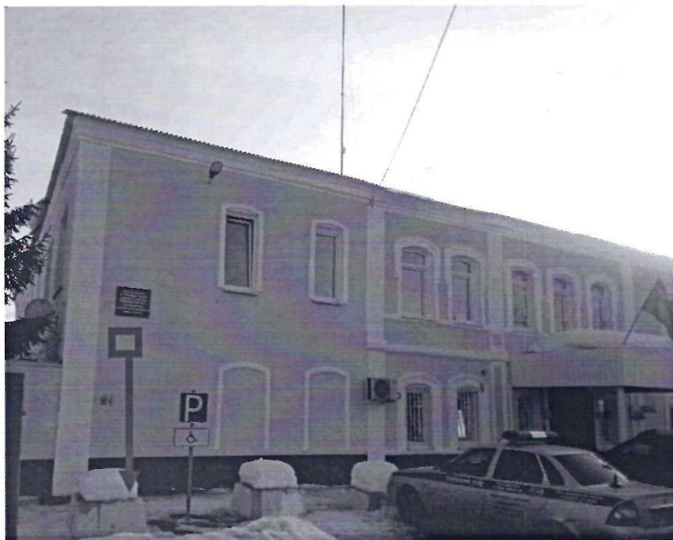
Фото фрагмента фасада с привязкой к месту установки информационной надписи.

5. Схема установки информационной надписи и фотофиксация на месте предполагаемого размещения (фотомонтаж)