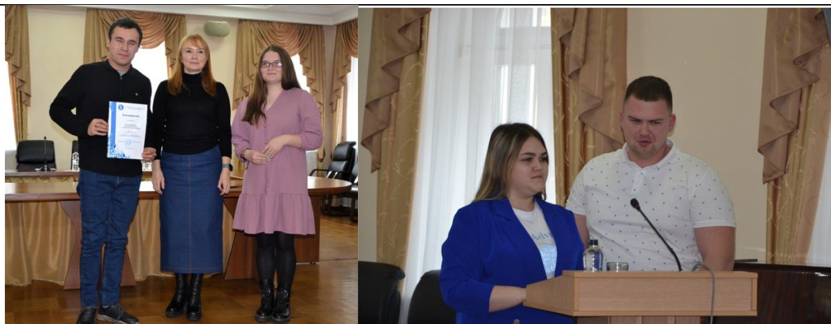
3. Итоговое совещание «Укрепление взаимоотношений в молодых семьях» в режиме ВКС