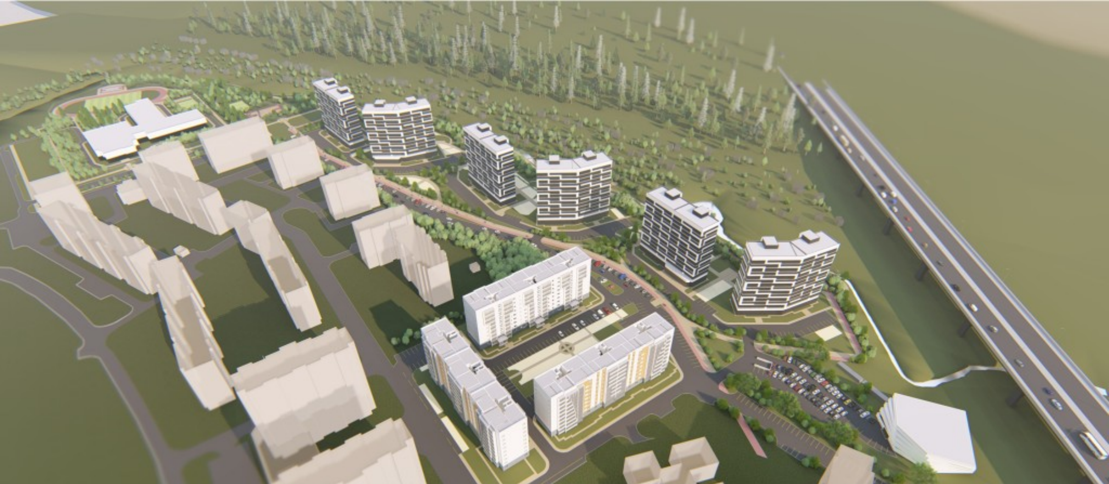
Общий вид на планируемую территорию микрорайона