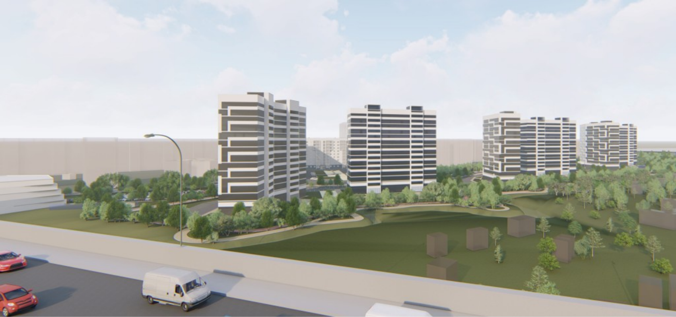
Вид со стороны ул. Эльменя (3-е транспортное кольцо)