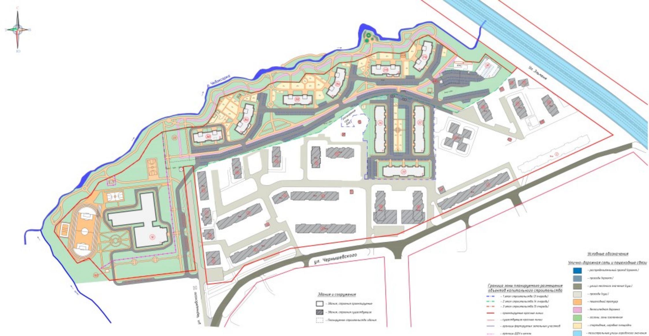
Генеральный план м-на Финская долина