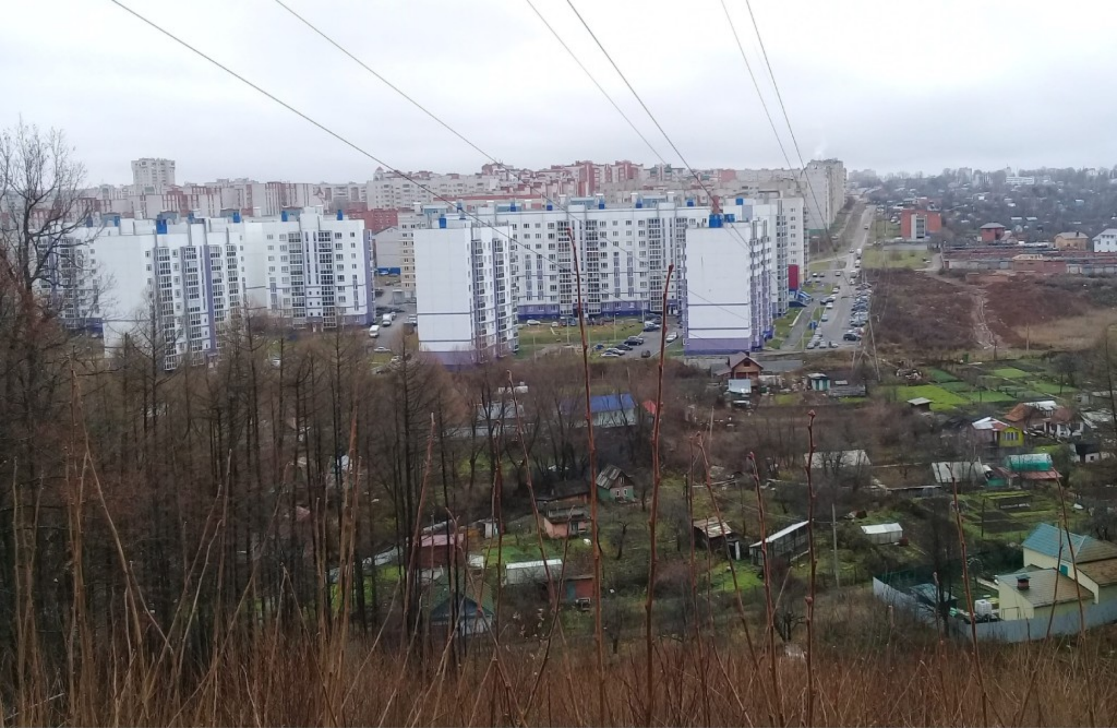
Сущ. застройка микрорайона со стороны р. Чебоксарка