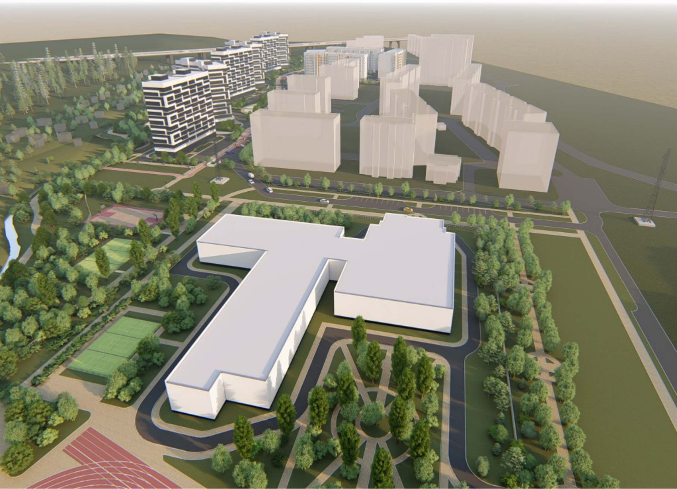
ВИДОВАЯ ТОЧКА 3