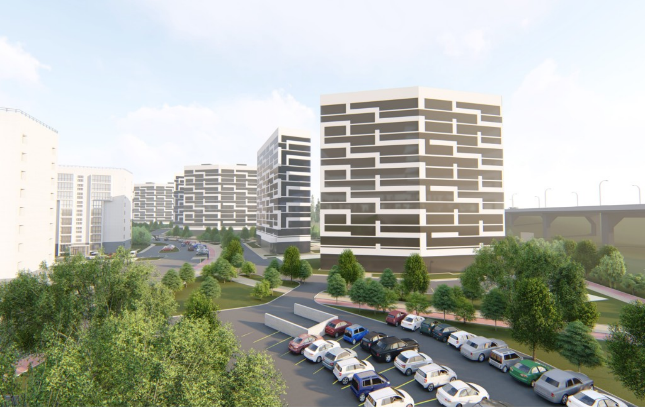
Видовая точка 1