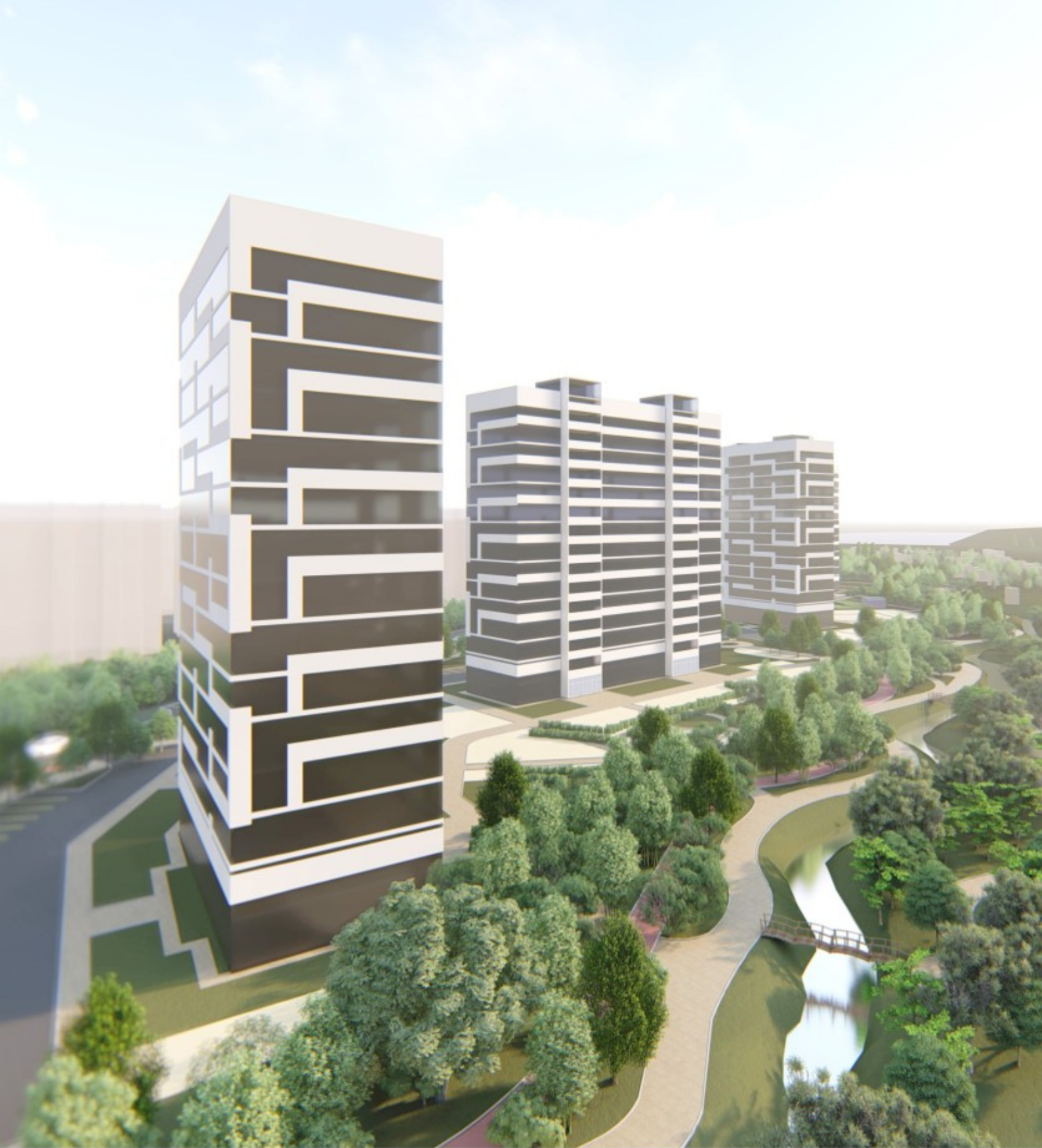
Видовая точка 2