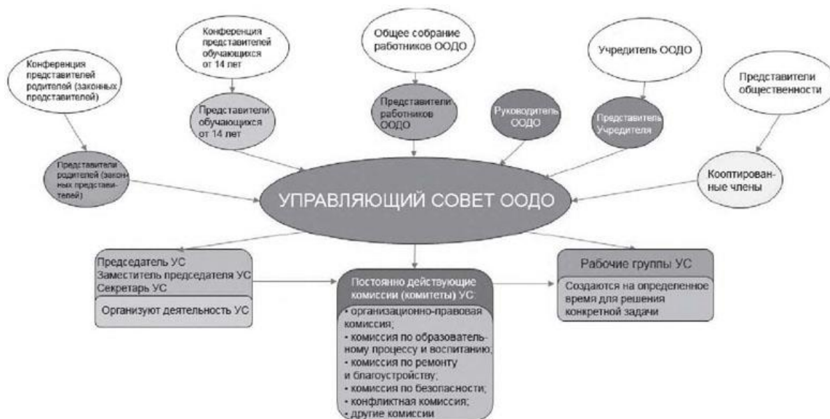
Рис. 2. "Управляющий совет образовательной организации дополнительного образования" (УС ООДО)