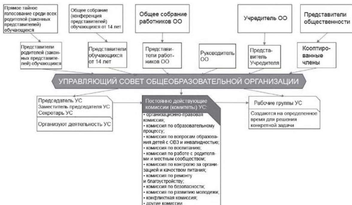
Рис. 1. Модель N 1 - "Управляющий совет общеобразовательной организации" (УС ОО)

Предлагаемая модель управляющего совета образовательной организации рассчитана на образовательные организации, реализующие образовательные программы начального общего, основного общего и среднего общего образования, которые располагаются в одном здании или в нескольких территориально разделенных структурных подразделениях.