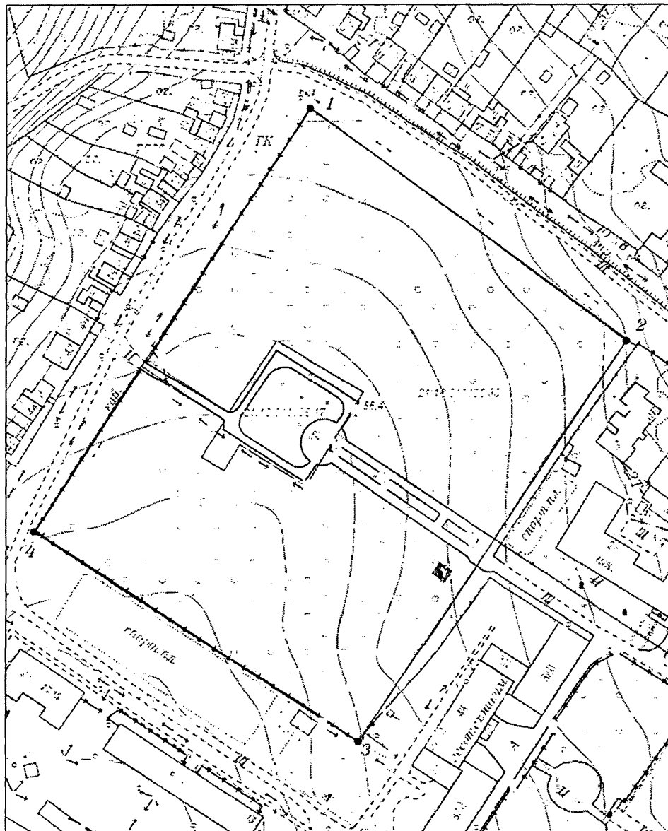
Схема границ территории объекта культурного наследия (достопримечательного места) регионального (республиканского) значения «Успенский парк», середина XIX в., расположенного по адресу: Чувашская Республика, Мариинско-Посадский муниципальный округ, г. Мариинский Посад, в квартале, ограниченном ул. Больничной, ул. Красноармейской, ул. Июльской (далее - объект культурного наследия).

Границы территории объекта культурного наследия (достопримечательного места) регионального (республиканского) значения «Успенский парк», середина XIX в., расположенного по адресу: Чувашская Республика, Мариинско-Посадский муниципальный округ, г. Мариинский Посад, в квартале, ограниченном ул. Больничной, ул. Красноармейской, ул. Июльской