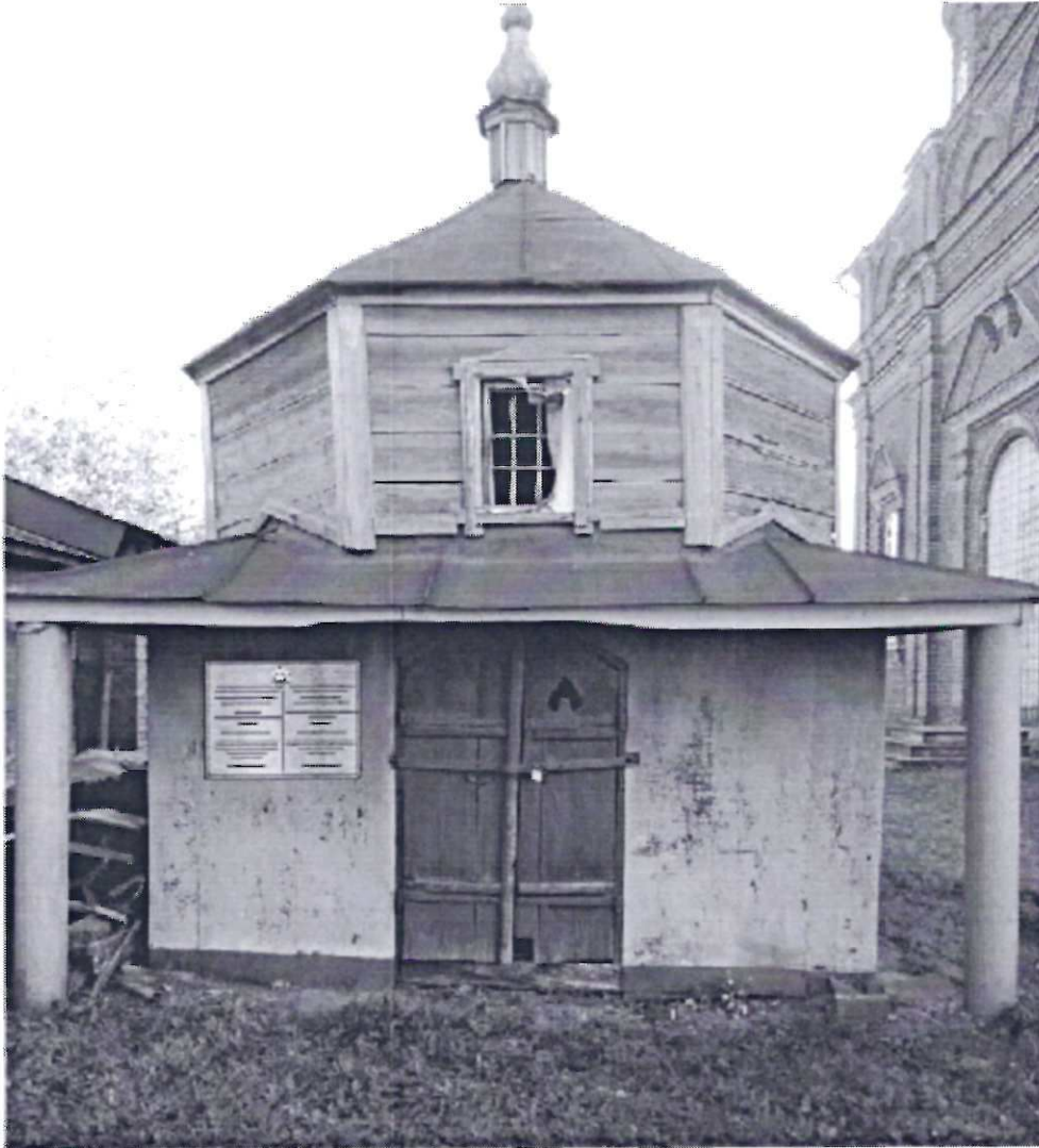
Фото фасада с привязкой к месту установки информационной надписи.