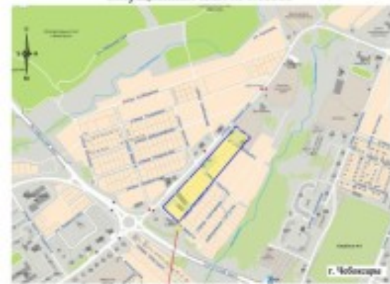
Ситуационный план М 1:10000