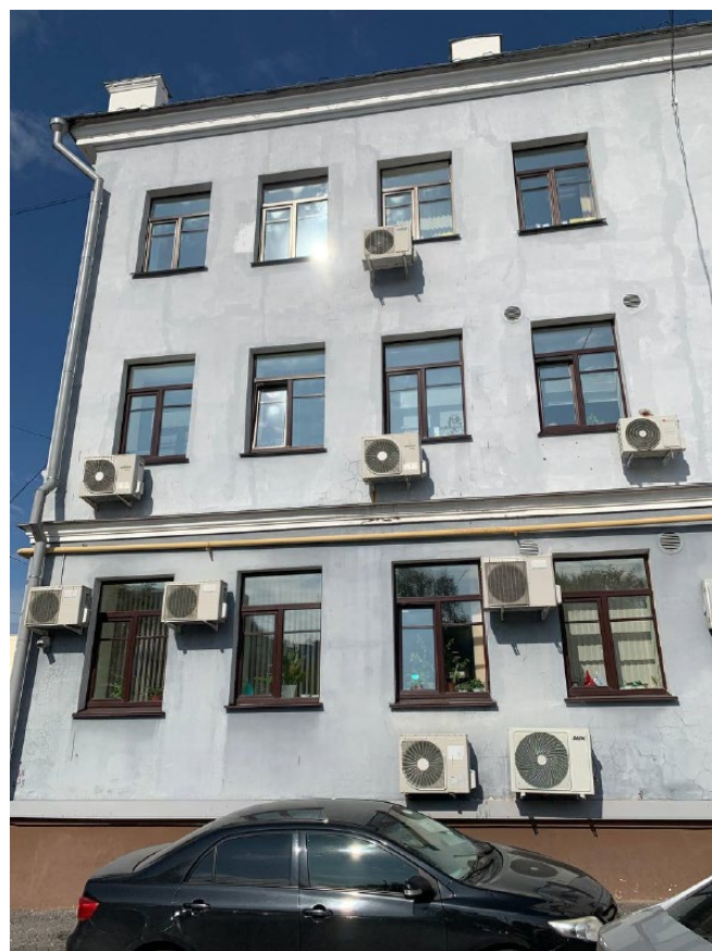
Фото 4. Фрагмент дворового фасада.