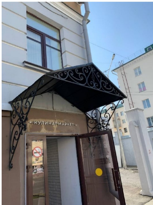
Фото 3. Входная группа в цокольный этаж со стороны ул. Композиторов Воробьевых.