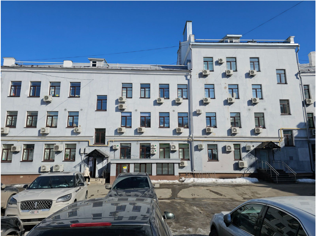
Фото 5. Фрагмент дворового фасада.