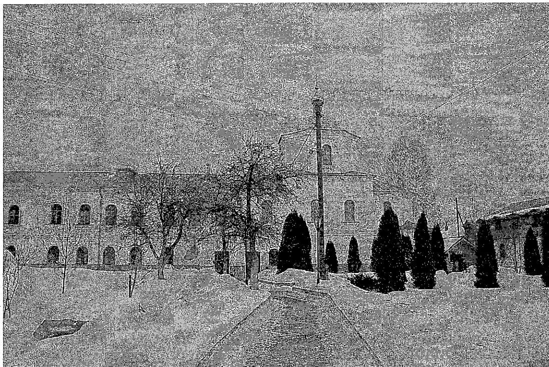
Фото 1. Общий вид.