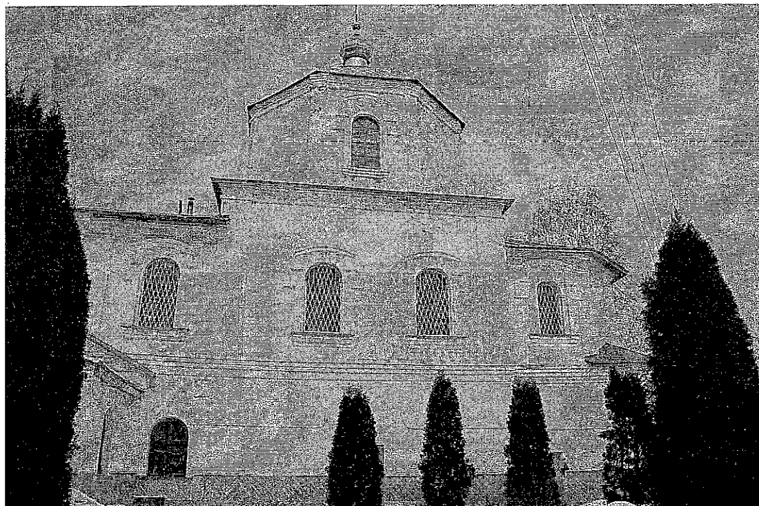
Фото 2. Южный фасад.