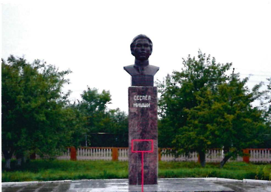
Фото памятник-бюста с привязкой к месту установки информационной надписи.