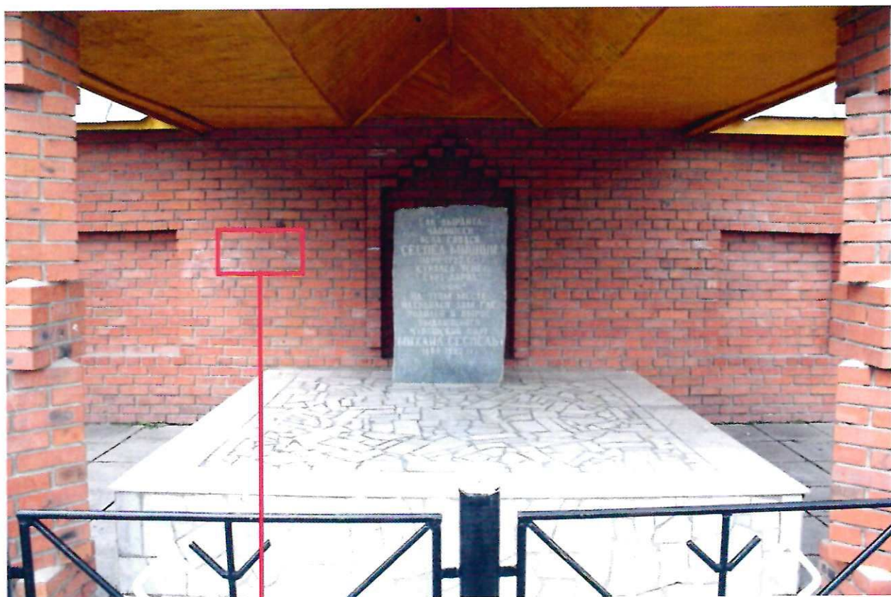
Фото фрагмента памятника с привязкой к месту установки информационной надписи.