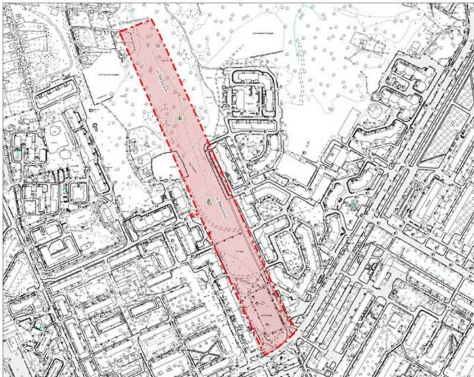
Схема расположение элемента планировочной структуры