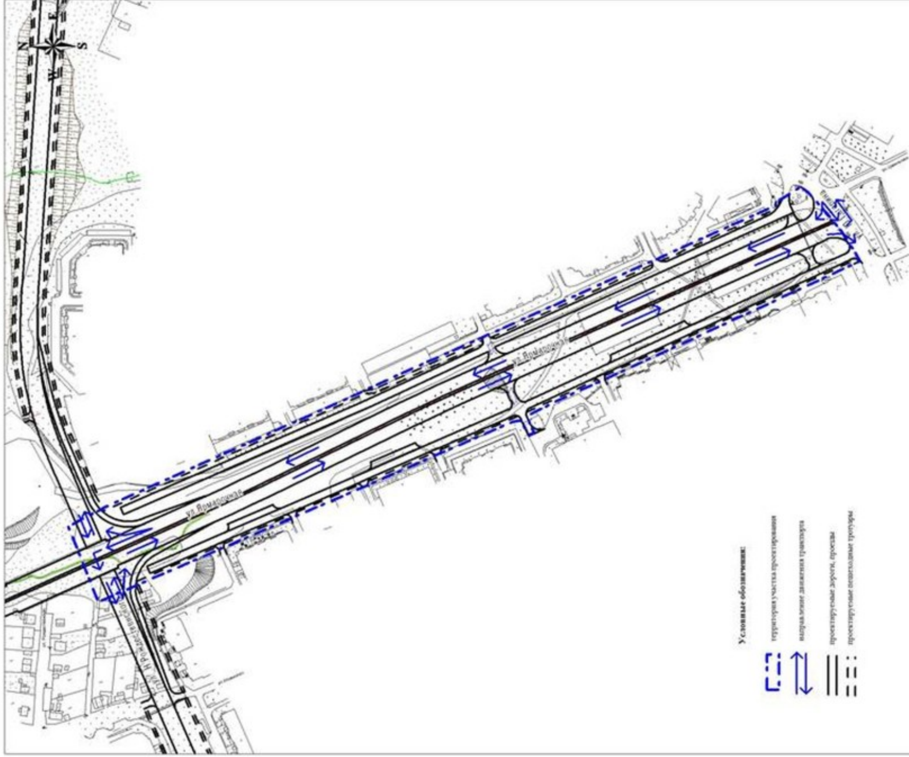
Схема организации улично – дорожной сети