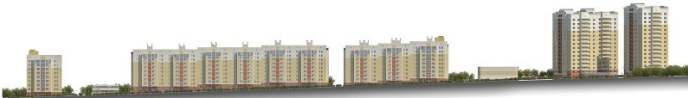
Развертка по ул. Островского