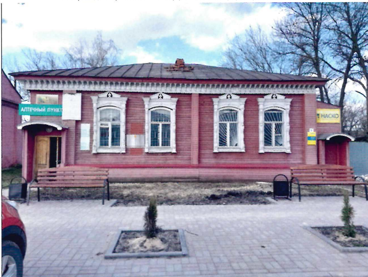
Фото фасада с привязкой к месту установки информационной надписи.